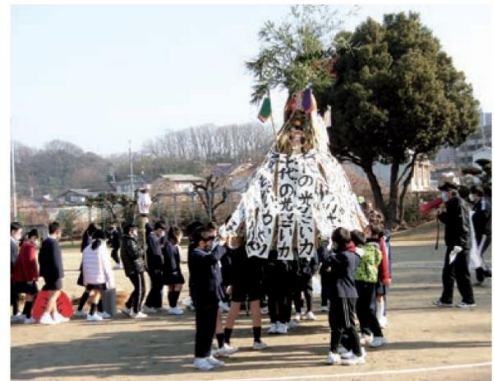
子どもとんど作り体験会の風景

まちづくり推進委員会では、少しでも地域活動に参加してもらおうと、季節ごとに行事を開催しております。盆踊りや秋の文化祭・芸能祭やとんどが主な行事ですが、将来に続けていくには後継者の育成が急務といえましょう。後継者作りの一環として、子ども達にとんど作りの楽しさを感じてもらおうと、小学3年生の総合学習の授業時間を利用して、子どもとんど作りの体験会を実施しています。