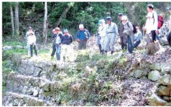
芦田大谷砂留現地研修の様子(現調査約200基)

芦田大谷砂留整備作業を行っています。先人の豊かな経験と優れた知識・土木技術によって築造された砂留は今現在も役立っており、「里山の名所」になるよう保存活動をしたいと思えます。