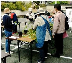
挿し木作業の様子

また、廉塾には古く中国から渡来した、年に数回咲く庚申(こうしん)バラがあります。二〇二五年に福山で世界バラ会議が開催されますので、地域に咲くバラで迎えようと、挿し木を行い、十一月に地域に配布する予定です。