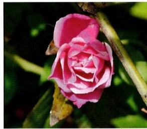
こころん けんしゅく 庚申バラ(廉塾バラ)