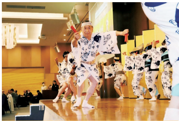
福山市古典芸能保存会