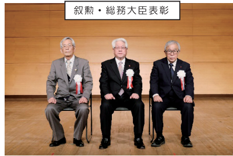
叙勲・総務大臣表彰