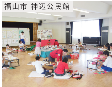
福山市 神辺公民館