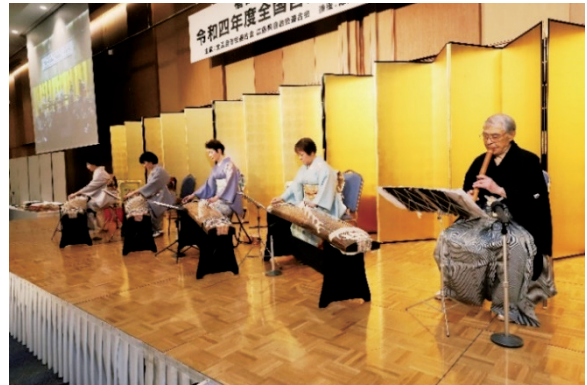
福山文化連盟邦楽部