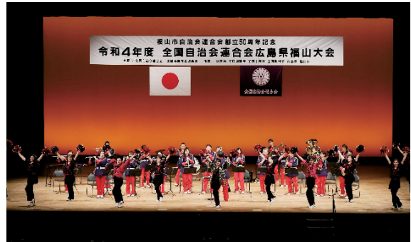
<オープニング演奏> 福山地区消防組合消防音楽隊・ 福山市消防団女性分団カラーガード隊