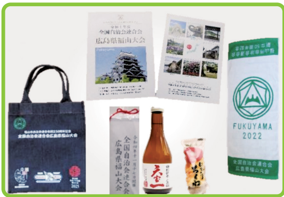
参加者記念品・大会冊子