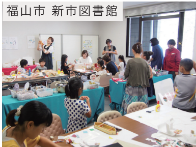
福山市 新市図書館