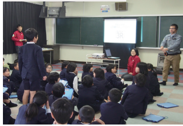
福山市立網引小学校