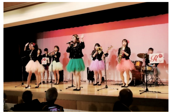
福山プラスアイドル ローズ・エンジェル