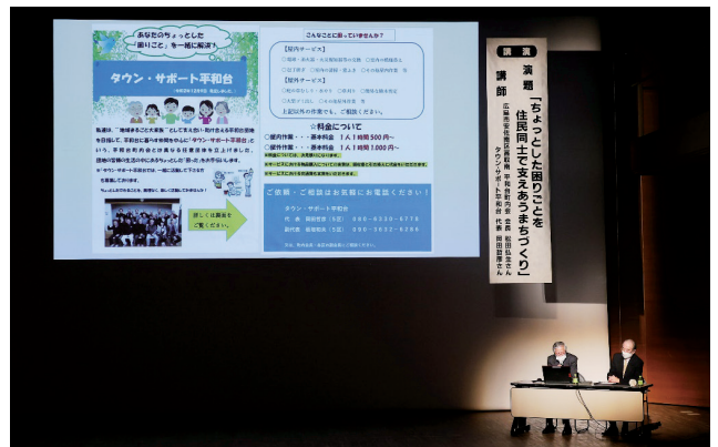
〈講演〉 広島市安佐南区高取南平和台町内会の皆さん