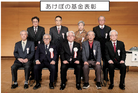
あけぼの基金表彰