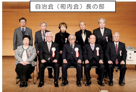
自治会(町内会)長の部