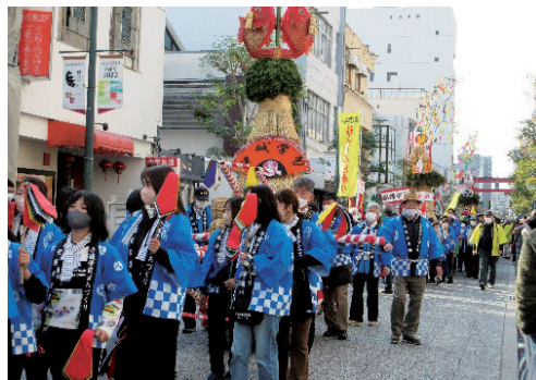
とんどの練り歩き風景

内海の埋め立てが始まると、世帯数も一気に増加し五千戸を超え、人口も一万人を超えるマンモス学区へと変貌しました。