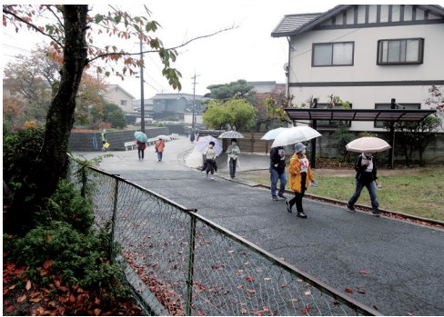
津之郷探検ウォークラリー

十一月十三日に小雨の中、津之郷の歴史の再発見を目的で、左写真のように、親子など多数の参加を頂き「津之郷探検ウォークラリー」を実施し、途中で歴史クイズも行い、参加者の皆様に大変喜んで頂きました。このように、地域の絆が明るいまちづくりにつながることを期待して、活動しています。