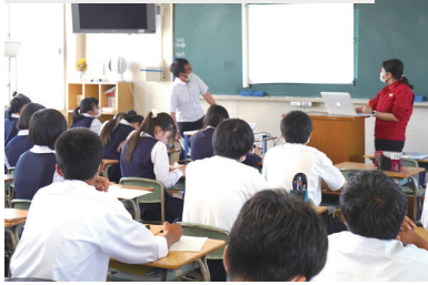
広島大学附属福山高等学校